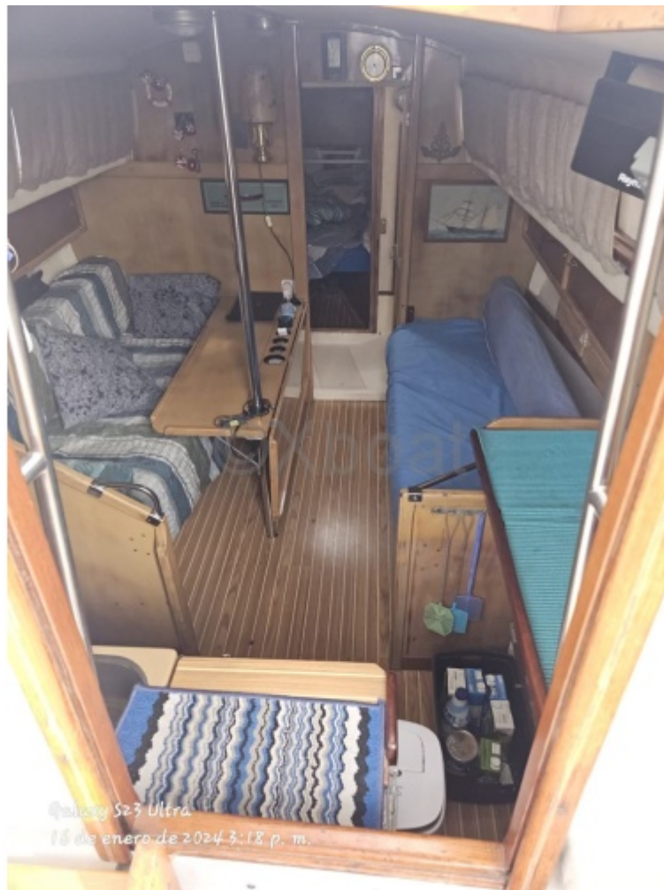
Galaxy S23 Ultra 16 de enero de 2024 3:18 p. m.