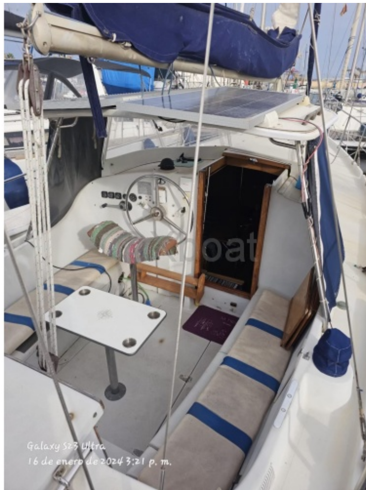
Galaxy S23 Ultra 16 de enero de 2024 3:21 p. m.