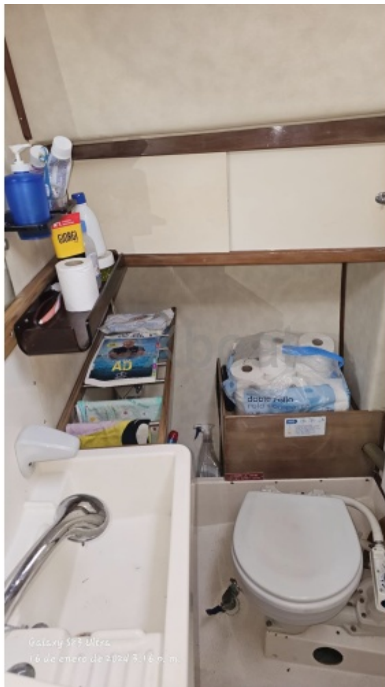
Galaxy S25 Ultra 6 de enero de 2024 9:14 a. m.