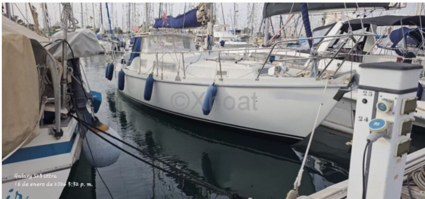
Galaxy 523 Ultra 16 de enero de 2024 3:32 p. m.